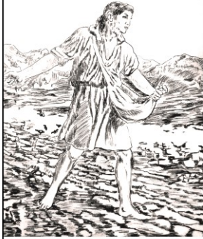
张熙和牧师 著 吴敏 译