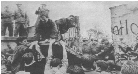
(拆掉“柏林墙”从小处做起)

因此而丧失了生命？对他们来说，没有自由，就没有生存的价值——“ 不自由，毋宁死 ”。