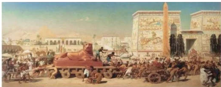
(以色列人在埃及做奴隶)

出埃及记记载着人类历史中最富戏剧性、最轰动，而且意义重大的事迹之一——二百万以色列人重获自由，浩浩荡荡地离开埃及。