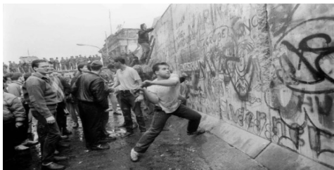
（柏林墙倒塌 25 周年纪念活动）

没有啊！有谁能保证给你找到工作呢？东德政府保证你不会失业，到了西德，什么保障都没有了。你知道你可能要面对失业及饥饿吗？如果你预备了要捱饿倒无所谓，不过又何必呢！况且，你目前这份工作还算不错，到了西方恐怕什么也没有了。前途没有一点保障，难道你还要去吗？”