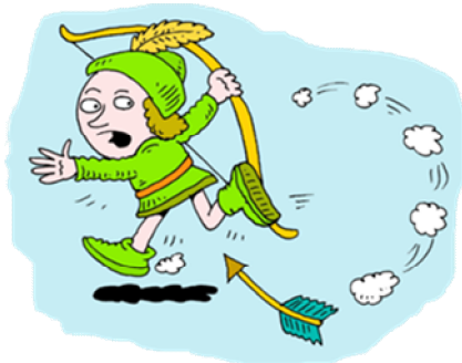
Be sure your sins will find you out

这是愚昧人的想法。神无所不知，圣经说：“你们的罪必追上你们”（民 32:23）。不要想欺骗永生神，不要想“人不知、鬼不晓”。大卫就是一个例子，他与别人的太太私通，又谋杀了人家的丈夫，一切都做得非常巧妙，没什么人知道，律法也不能定他的罪。但神知道，神差遣先知拿单去说出他的罪，也说出了他的惩罚。