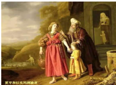
夏甲和以实玛利被逐

试想想，如果当年亚伯拉罕肯坚持等候上帝的应许，不听从撒拉的鬼主意，那么他们就不会生了以实玛利。如果没有以实玛利，那么就不会有阿拉伯人和以色列人的冲突，更不会因着他们之间的冲突而波及其他民族。如果亚伯拉罕当年立场坚定，不听从撒拉的摆布，今天世界的局势是否会改写呢？911的事件有可能就不会发生了。虽然今天一切已经成了定局，我们已经没有办法