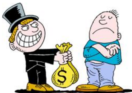
要藉着那不义的钱财结交朋友！

再比如找工作，或者换工作，你会以什么标准来做选择呢？是赚钱多，有好的发展前景吗？世人都会这样选择，但一个追求神的人如果也以这个标准来选择，你觉得讨神的喜